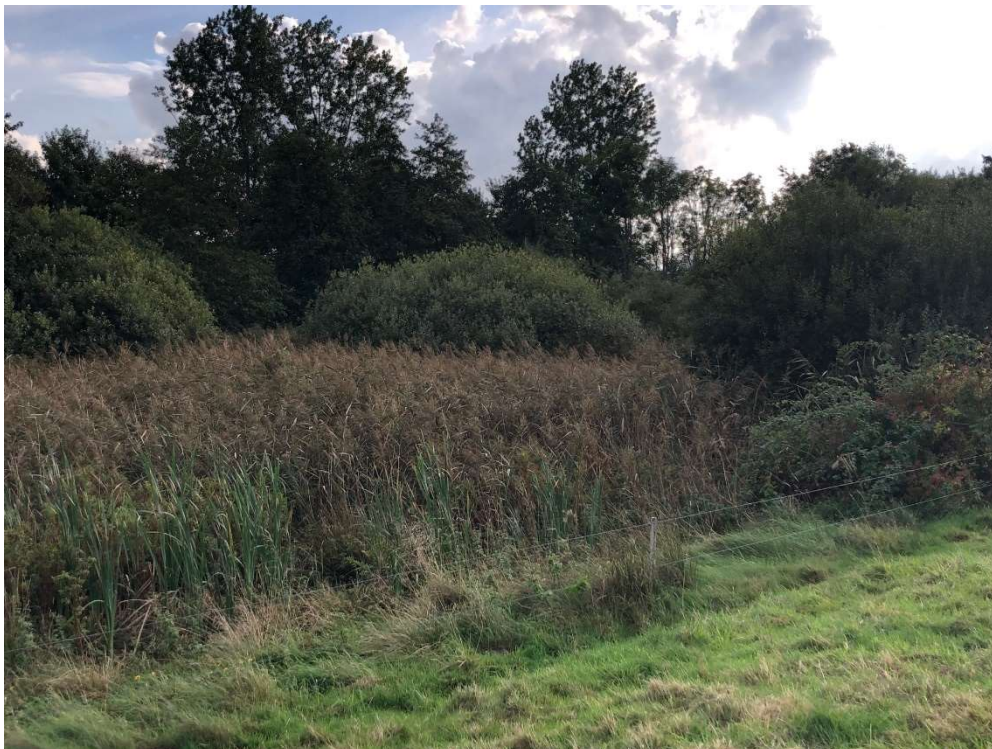
Foto af B005 fra Kommunens besigtigelse september 2021. De højere træer i baggrunden står udenfor bassinet.

Jeg besøgte arealet den 29. september 2021. Bassinet er i dag uden synlig vandflade og fuldstændig udfyldt af en sammenhængende sumpplantevegetation af bredbladet dunhammer, tagrør, lodden dueurt, lyse-siv og stor nælde. Ved kanten står også en del opvækst af femhannet pil og båndpil, som i nogle tilfælde er indtil ca. 4 m høje. Der ses mindre planter af ask, ahorn og mangeblomstret rose imellem sumpplanterne.